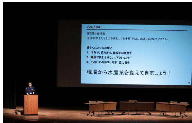
キーノートスピーチ 第1回サミットの振り返り Keynote Speech Reflections on the 1st Summit

Japanese and Global Fisheries Industry through Data