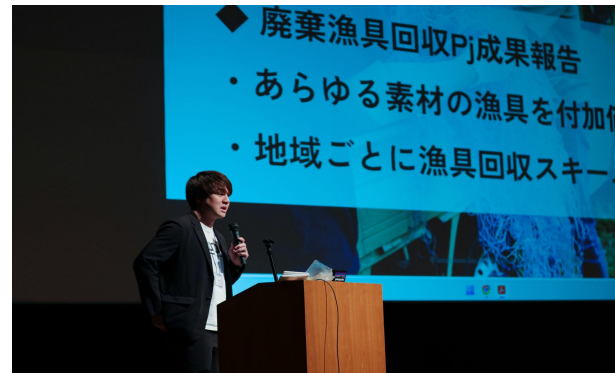
プロジェクト成果発表⑥

Project Outcome Presentation 5 Marine Education + School Lunch and Cafeteria Project