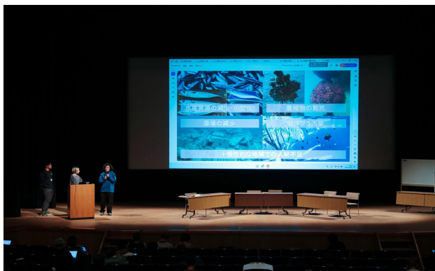
プロジェクト成果発表⑦ FJ研究所 Project Outcome Presentation 7 FJ Research Institute