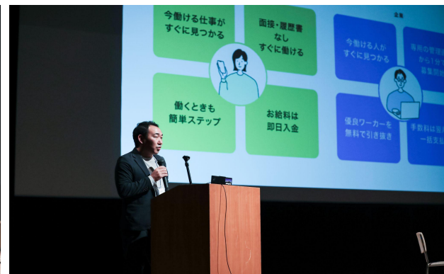
スポンサー発表 タイミー様 Sponsor Presentations Timee, Inc.