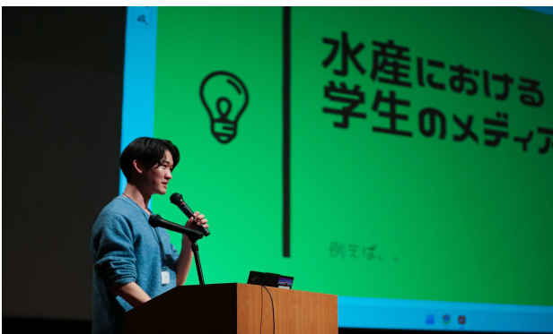
プロジェクト成果発表④

Project Outcome Presentation 3 Sustainable Seafood Promotion Project