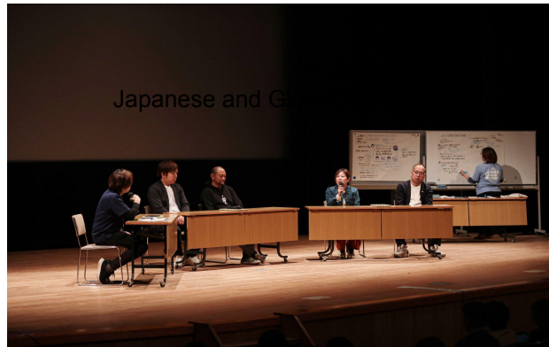
パネルディスカッション① 日本の海面魚類養殖の課題と展望