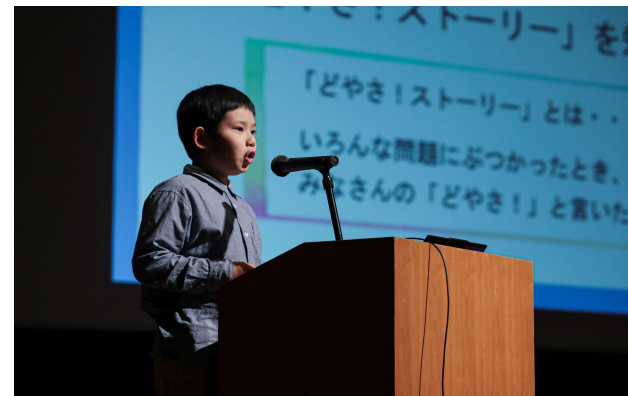
地元小学生の 水産振興の取り組み発表 Presentations from local elementary school students about their initiatives for fisheries promotion