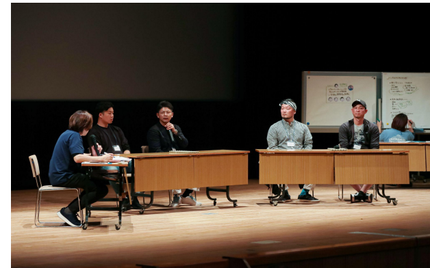
パネルディスカッション③ 全国の漁業者の挑戦

Challenges of Fisheries Companies Nationwide