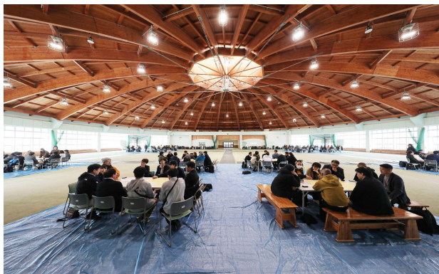
テーマ別ディスカッション① Topic-based Discussion 1