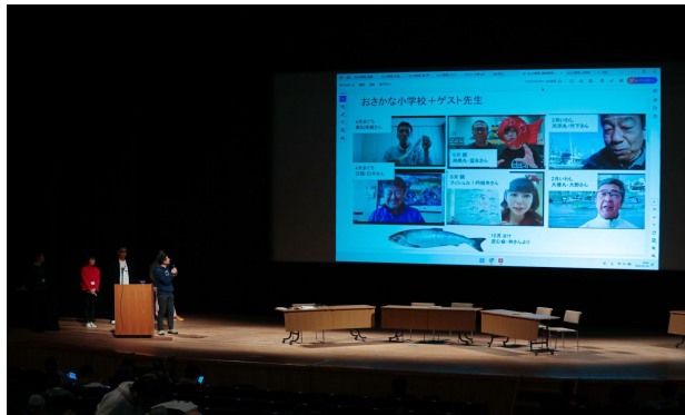
プロジェクト成果発表⑤

Project Outcome Presentation 4 Fisheries Industry Real Media Project