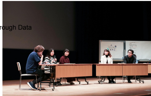
パネルディスカッション② 全国の水産会社の挑戦

Challenges and Prospects for Japan's Marine Fish Farming