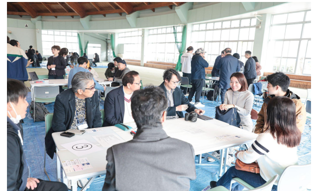
テーマ別ディスカッション③ Topic-based Discussion 3