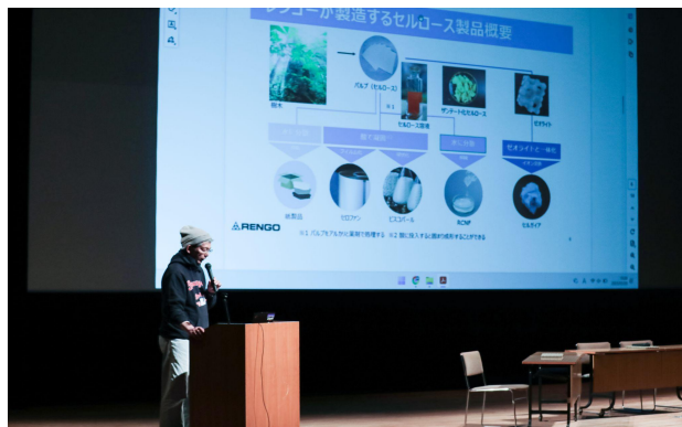
スポンサー発表 レンゴー様 Sponsor Presentations Rengo Co., Ltd.