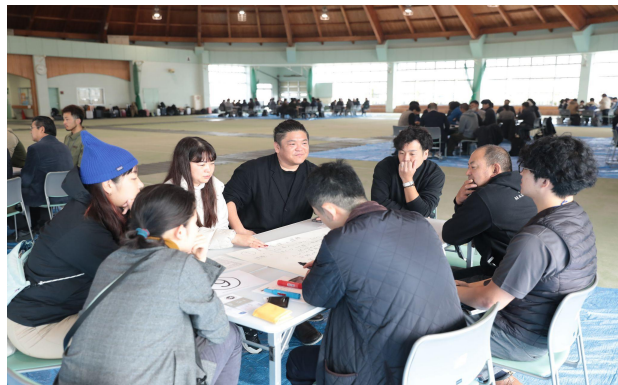
テーマ別ディスカッション② Topic-based Discussion 2