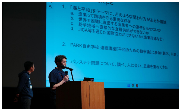
プロジェクト成果発表②

Project Outcome Presentation 1 Fisheries Budget Study Group