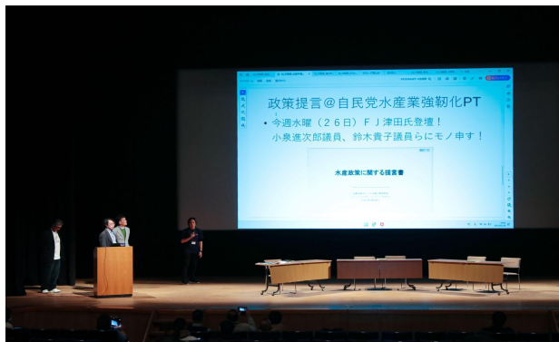
プロジェクト成果発表①