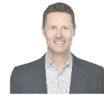
ロバート・ジョンソン

The elimination of IUU fisheries from the supply chain is a common issue for the international fishing industry. So far, many measures have been put in place, including the establishment of legal systems by countries and regions and the introduction of traceability by companies, but new issues are now being discussed in the international community, such as the need for a traceability system that can be used interchangeably and the need to increase transparency throughout the entire supply chain, including at sea. In this session (panel), we will discuss the future of traceability systems, the need for interoperability, ensuring transparency, and the importance of scrutinizing information, while confirming the roles of companies and governments.